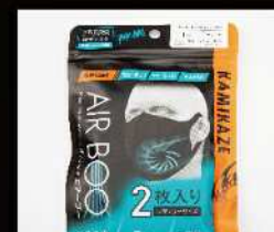
BOO-B-F2 2 枚入りパッケージ