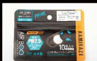
BOO-AIR 10 枚入りパッケージ